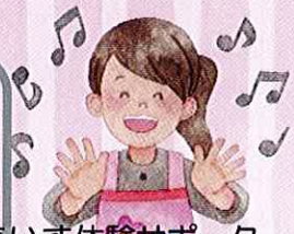
車いす体験サポーター Cさん

「体験学習」のことを知って、興味がわき参加しました。小さい頃から障がい理解のための体験をすることにより、街中で車いすの方が困っているような場面に出合ったとき、この経験をもとに勇気を出してお手伝いすることができるのではないかと思います。