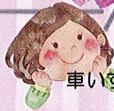
車いす体験サポーター Aさん

小学生に車椅子の操作を言葉で説明するのが難しかったけれど、自分でも車椅子の操作を理解した上で説明ができました。私にとっても貴重な経験になりました。これからも積極的にボランティアをしていきたいと思います。