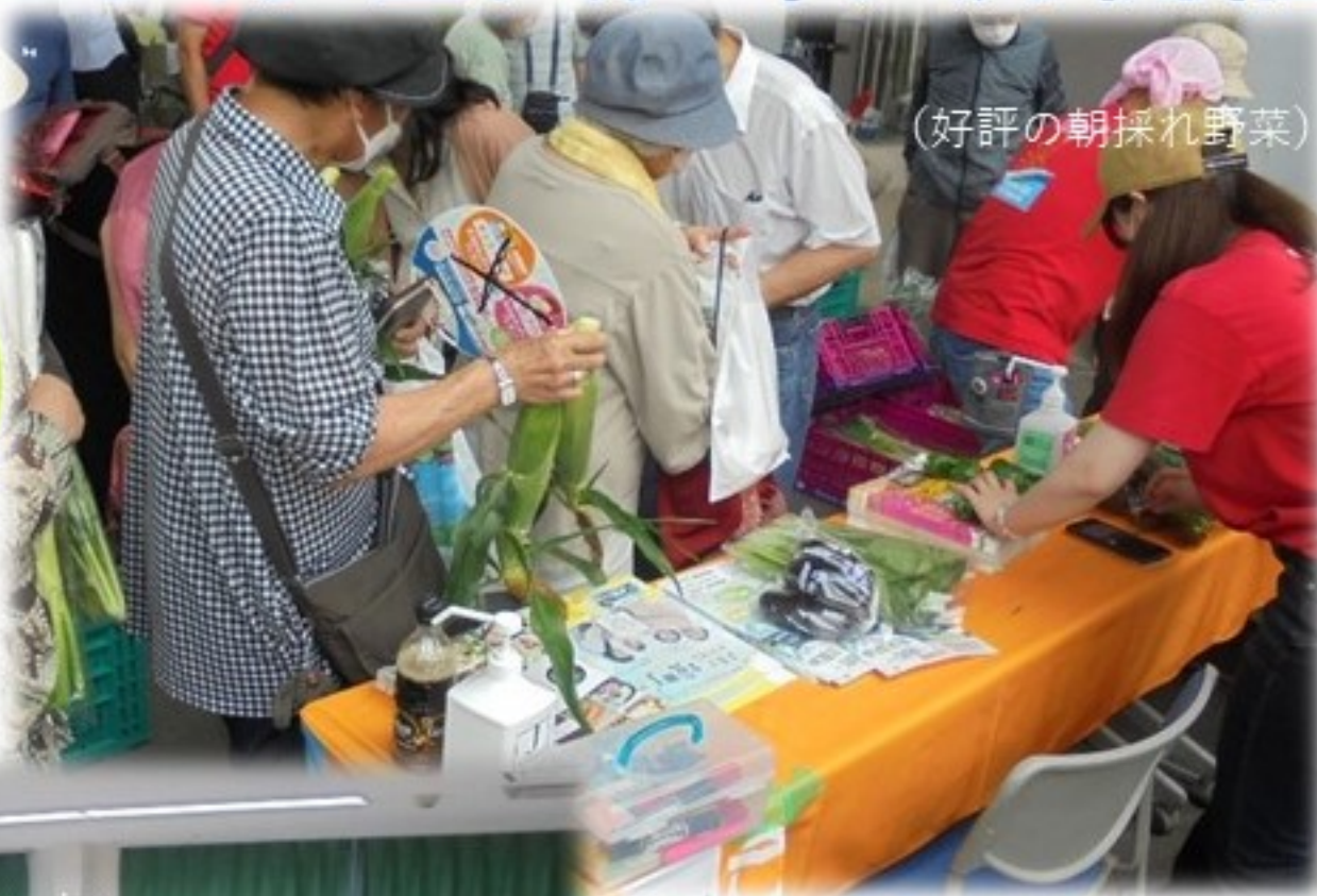
(好評の朝採れ野菜)