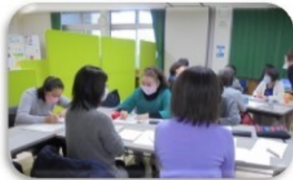
「実際に使われたチラシについてディスカッション」

チラシと企画、どちらかが0(ゼロ)だともう一方も0(ゼロ)。どちらにも時間をかけないといけない。では、どうやって人が来る企画をつくるのか、そのためのチラシを作るポイントは何かなど、具体的な方法についても教えていただき、明日から実践できる内容の濃い講座でした。