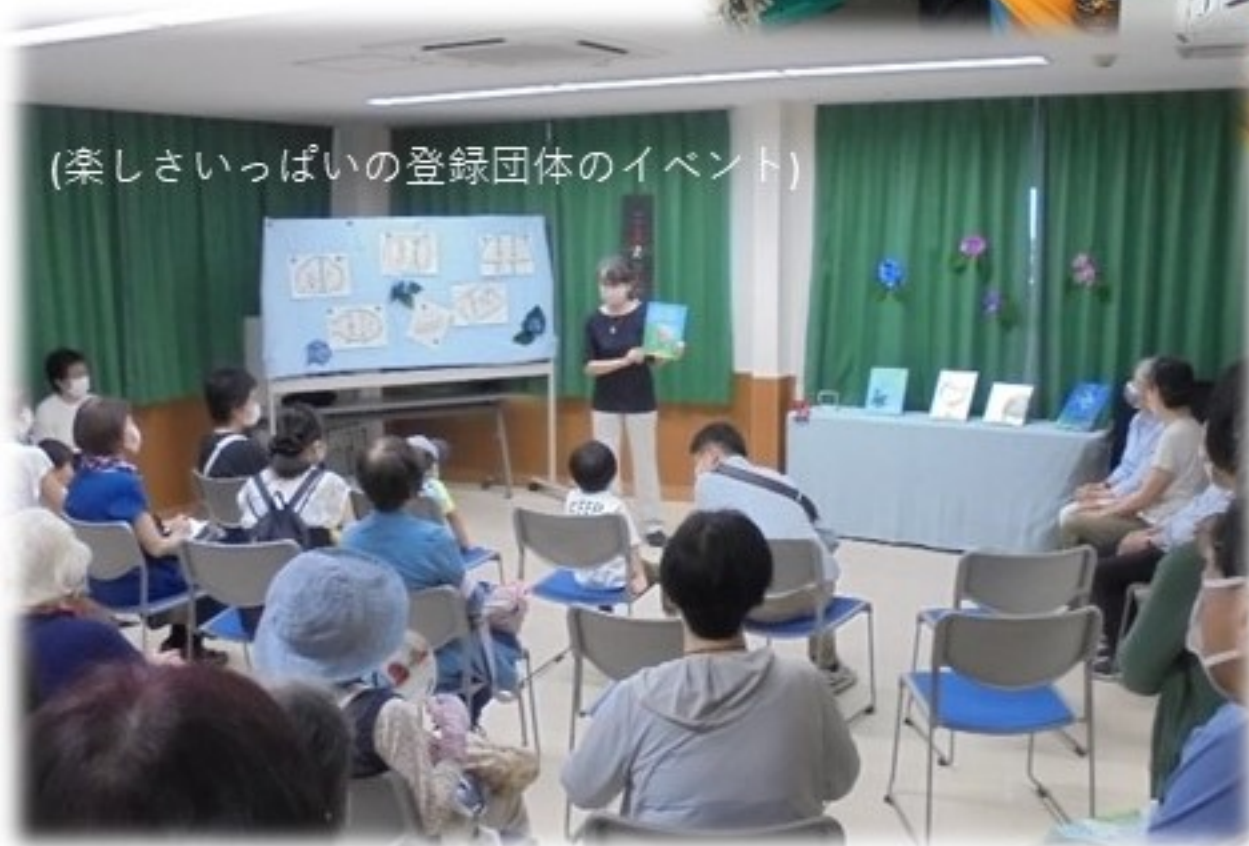
(楽しさいっぱいの登録団体のイベント)

狛江市市民活動支援センター（こまえくぼ1234）をより多くの皆様に知っていただき、利用に結びつけていただければという思いで、昨年度からフェスティバルをスタートしました。