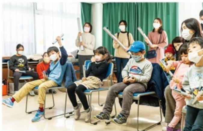
興味津々！みんなはじめてのトーンチャイム。(体験イベントトーンチャイムをならそう！)

はびみゅーずはフィギュアノートに心を動かされ、「音楽を奏でる喜び、Happyをもっともっとたくさんの人に届けたい！」という思いから、2015年に立ち上げられました。