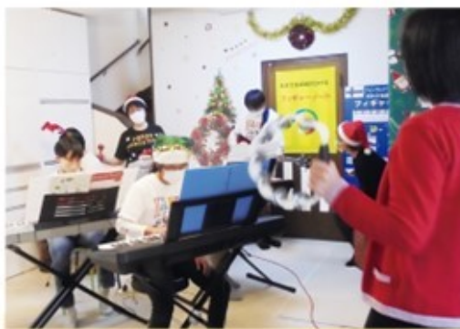
みんなで合奏。2022年12月17日(土) クリスマスコンサート