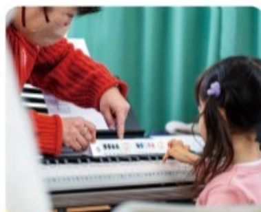
色や形のシールを目印に、ふれて、遊んでね！

や内気で友達作りが苦手な子どもなど、障がいのあるなしに関係なく全員で楽しむことができる」と語ります。