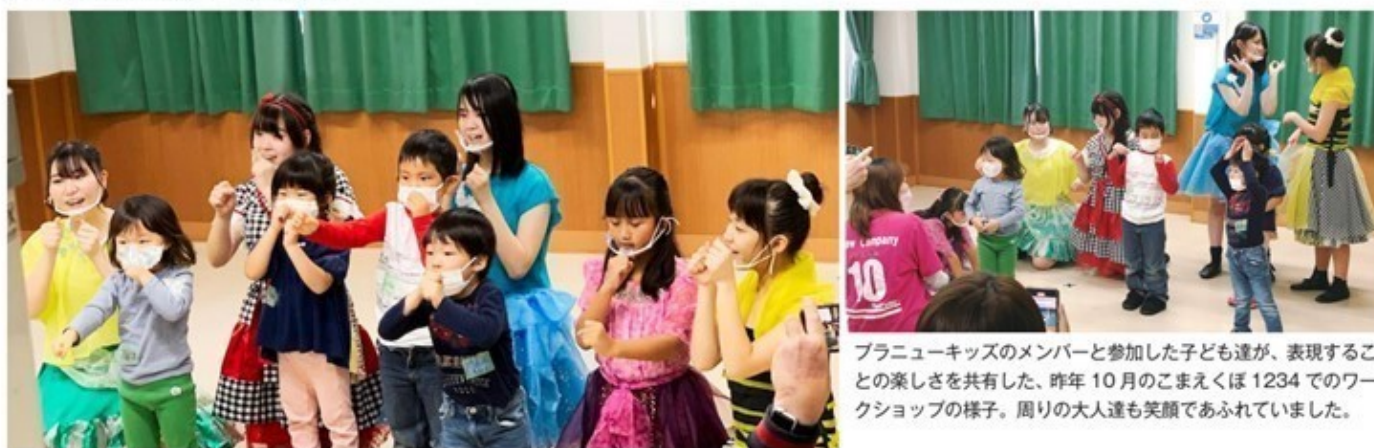
プラスニューキッズのメンバーと参加した子ども達が、表現することの楽しさを共有した、昨年10月のこまえくぼ1234でのワークショップの様子。周りの大人達も笑顔であふれていました。

“演劇と教育を結び付けよう”という趣旨のもと活動をしている+ new Companyは2009年から活動をはじめます。脚本から音楽、全てオリジナルミュージカルである“千年に1度の奇跡”シリーズの『ランの宝物』～ランとティンラの小さな旅～は第23回目の公演を迎えました。耳が大きいことで昔から辛い経験をしてきた少しやんちゃな少年の妖精ランと、声の出ない少女ティンラの二人の主人公を物語は軸に据えています。この主人公ランを、小学3年生の二人の子ども達が演じました。