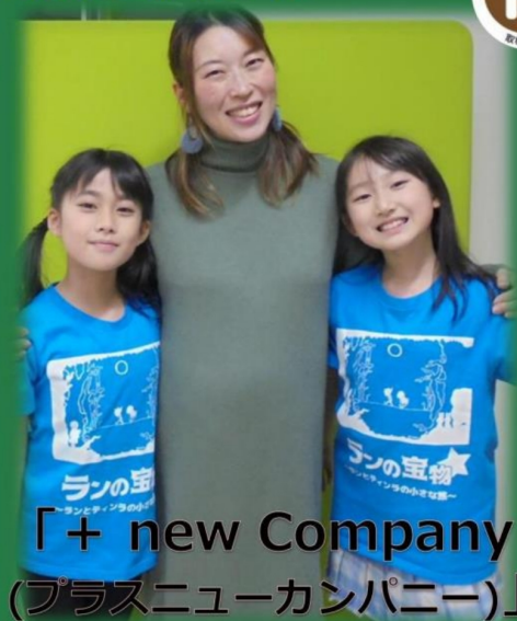
「+ new Company (プラスニューカンパニー)」