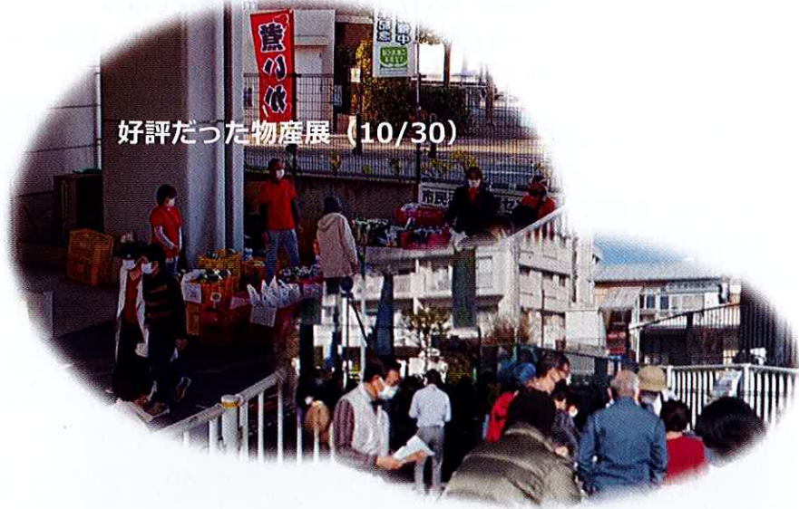
好評だった物産展（10/30）