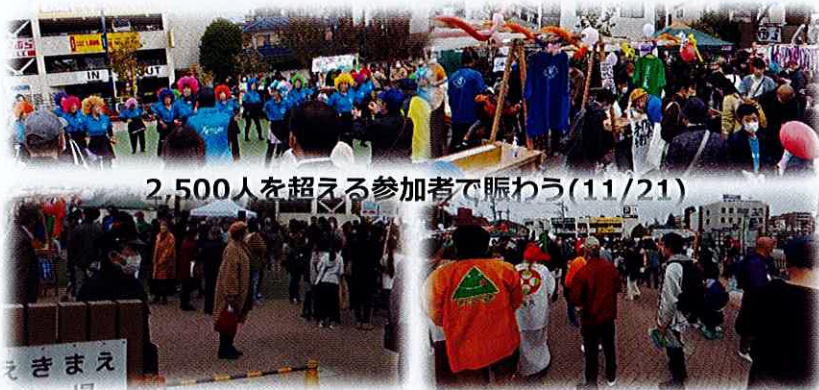
2,500人を超える参加者で賑わう（11/21）