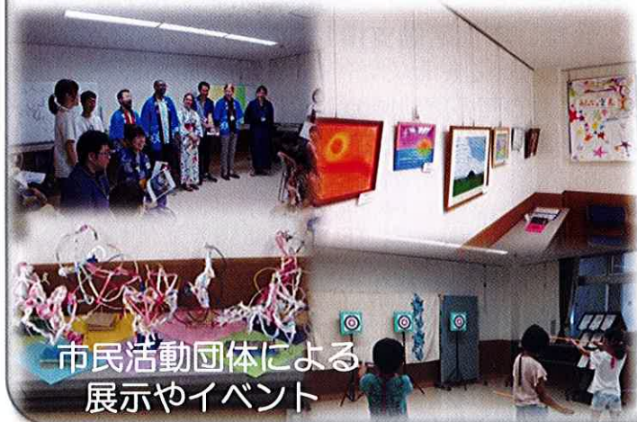
市民活動団体による 展示やイベント