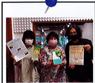
2021年7月2日 NPO フードバンク狛江