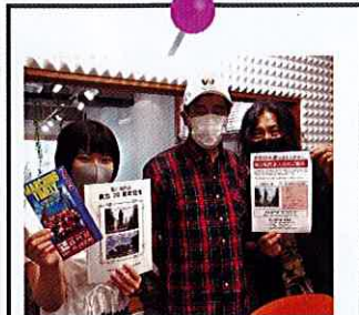
2021年7月16日 狛江稲門会