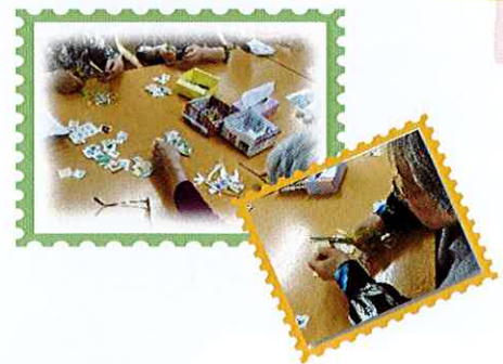
デイプラス狛江のいずみでの活動風景