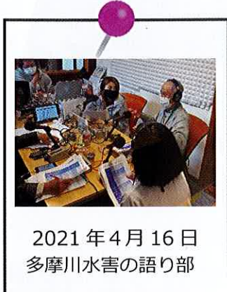
2021年4月16日 多摩川水害の語り部