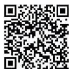
城南信用金庫狛江支店