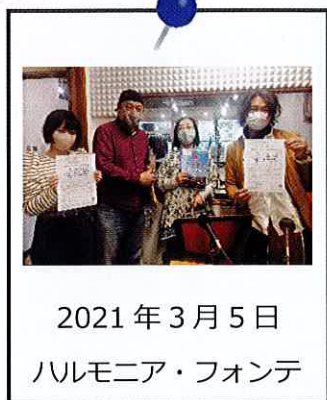
2021年3月5日 ハレモニア・フォンテ

コマラジ「KOMAE AM フライデーアートサーカス」に 出演 してきました！ 令和3年3・4月は4つの市民活動団体の方々に出演いただきました