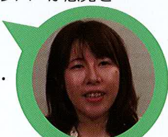
こまえくぼ1234 体験学習部会