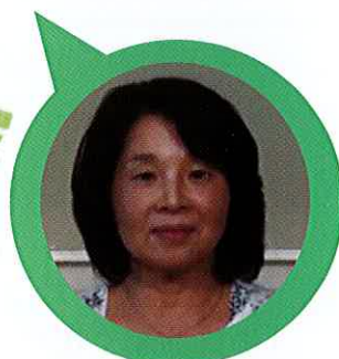
こまえくぼ 1234 体験学習部会