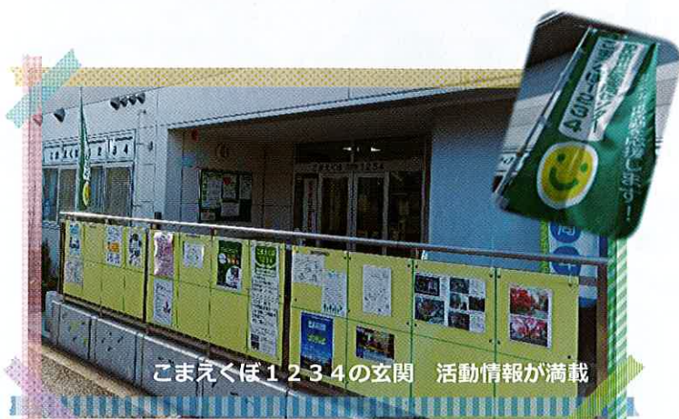
こまえくぼ 1234 の玄関 活動情報が満載