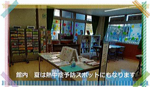
館内 夏は熱中症予防スポットにもなります

「情報を集める」 こまえくぼ 1234 内やホームページで各種情報を発信しています。掘りだし情報もあるので、ぜひご覧ください。