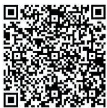
狛江市 公式 YouTube