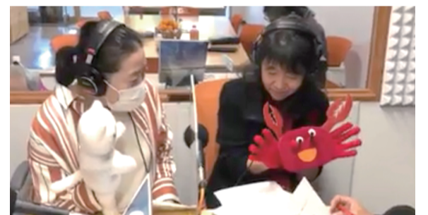
KOMAE AM フライデーアートサーカス 金曜日 10時～10時30分のコーナー出演

私達は人形劇や絵本で多様性を伝えたい、と活動しています。そこで、生放送のスタジオで、ミニ人形劇をすることにしました。たとえリスナーには見えなくても、普段行っている人形劇やサークル手作りのユニークで可愛い人形を知って欲しいと思ったからです。パーソナリティの野崎さんが、リスナーに伝わるよう人形達を説明してくださり、約2分の短いものでしたが、思いの伝わる人形劇ができました。その上、ディレクターさんがその動画をコマラジのFacebookに載せてくださったのです!その後こまえくぼのホームページにも載せていただいたおかげで、沢山の方が視聴してくれています。「ラジオだから見えない」ではなく「ラジオでも見える」又、こまえくぼのホームページを活用して今後の活動にも繋がる貴重で新しい体験でした。