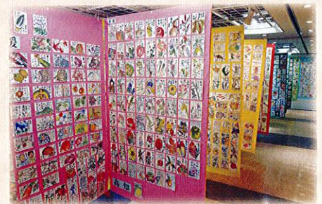
平成24年度 公募展の様子