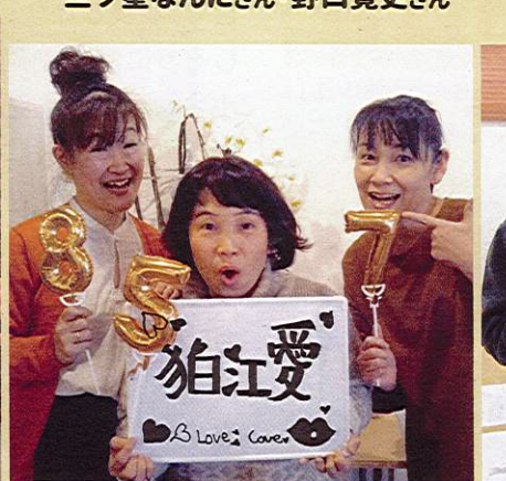
ナオティ・カヨティ・ミワティ(コマエンジェル)