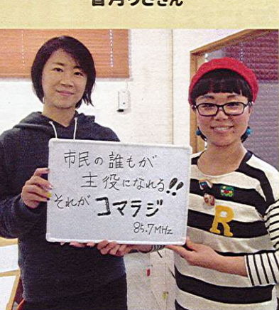
ユウティ・ジュンティ(コマエンジェル)