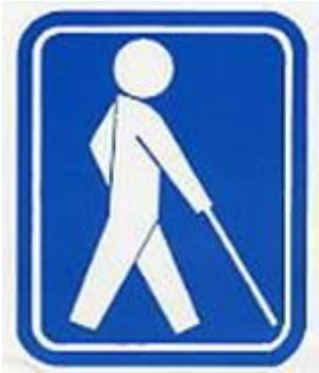
盲人の国際シンボルマーク 本物は青字に白抜き